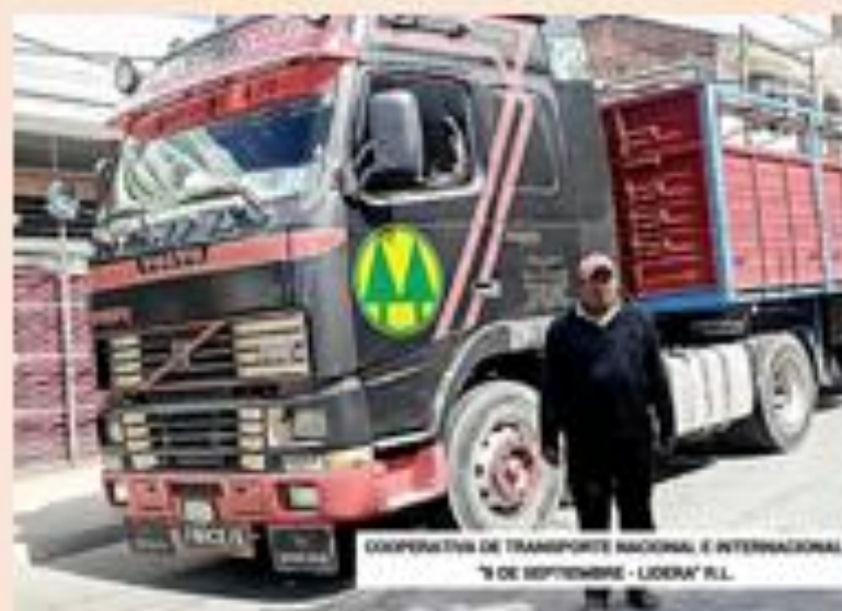
COOPERATIVA DE TRANSPORTE NACIONAL E INTERNACIONAL "9 DE SEPTIEMBRE - LIDERA" R.L.