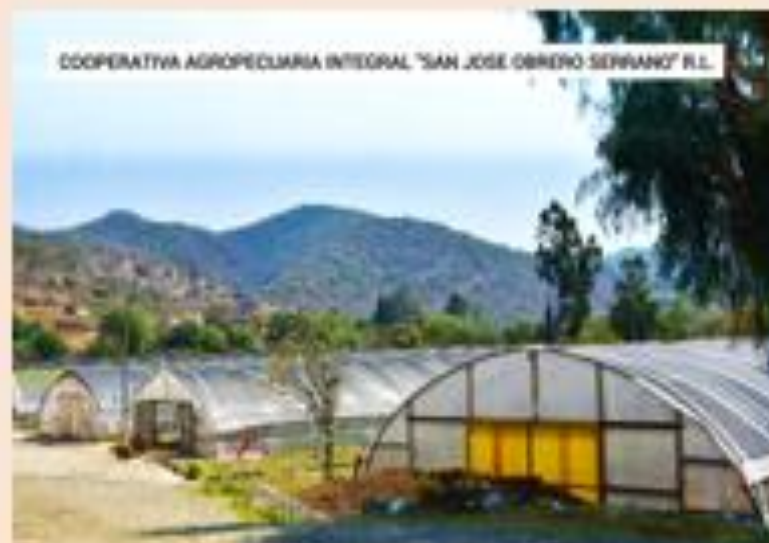
COOPERATIVA AGROPECUARIA INTEGRAL "SAN JOSE OBRERO-SERRANO" R.L.