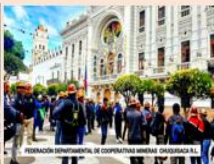
FEDERACIÓN DEPARTAMENTAL DE COOPERATIVAS MINERAS CHUKISACA R.L.